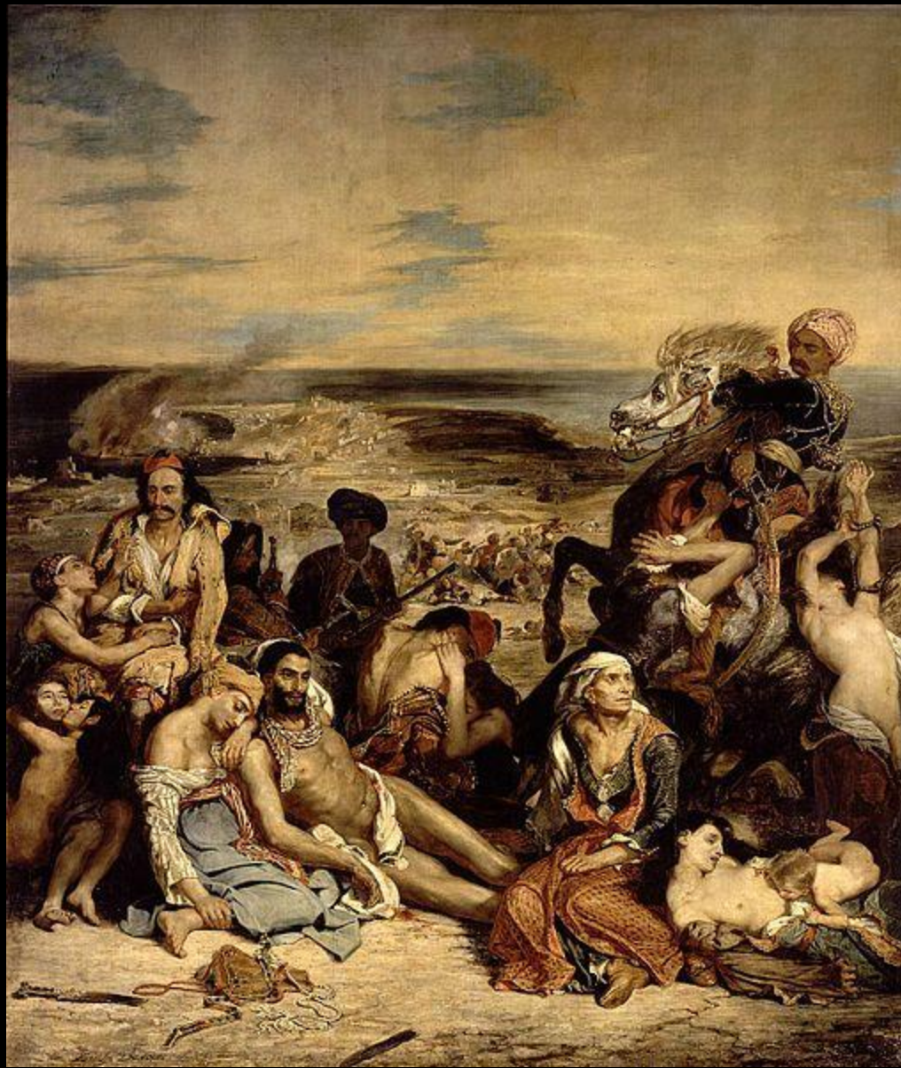
O Massacre de Scio