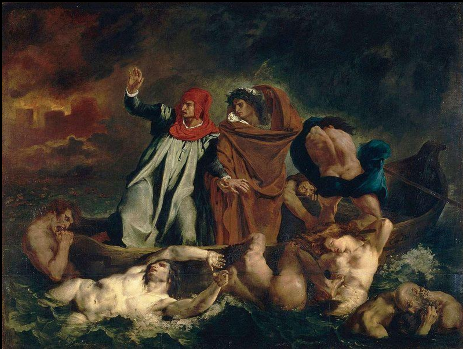
A Barca de Dante — primeira obra