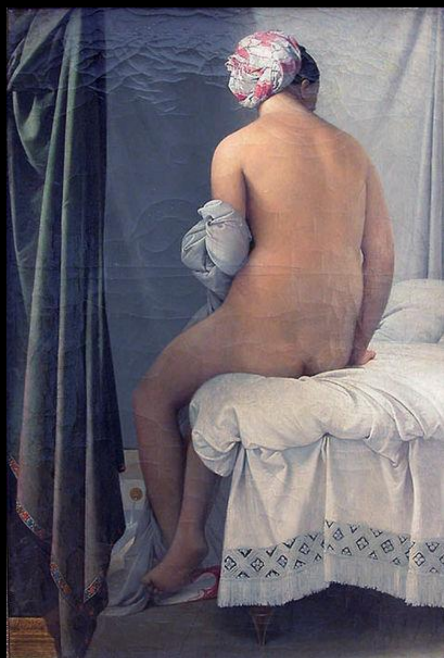
Jean Auguste Dominique Ingres

História , literatura e mitologia antigas - fonte principal de inspiração para os artistas, reavaliadas com outras culturas e estilos antigos