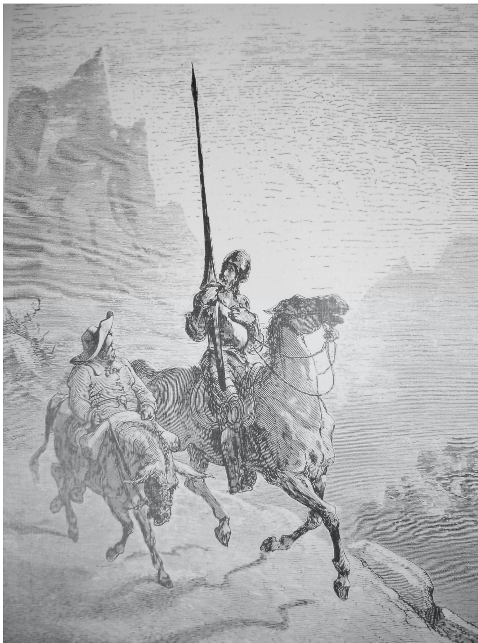
Imagem 5: Don Quijote y Sancho Panza , grabado de Gustavo Doré (CMC/Associação Colégio Español de São Paulo, 1987).