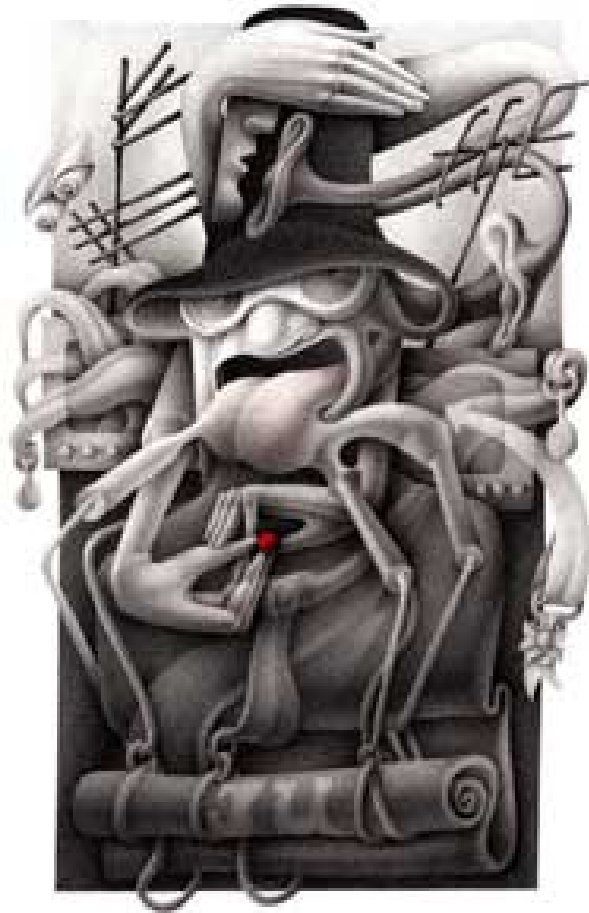
Imagem 1: “ La coima ” de Julián Usandizaga. Logotipo oficial do I Congreso de laS lenguaS, Por el reconocimiento de una Iberoamérica pluricultural y multilíngüe , Rosario, 2004.