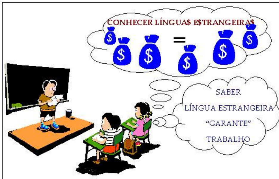
Imagem 7: Saber língua estrangeira significa ter emprego e ascensão financeira. (SOUZA et al , 2006, p.391)

Podemos perceber no discurso dos aprendizes uma visão de Língua Estrangeira enquanto “chave de acesso” ao mercado de trabalho e ao status social: