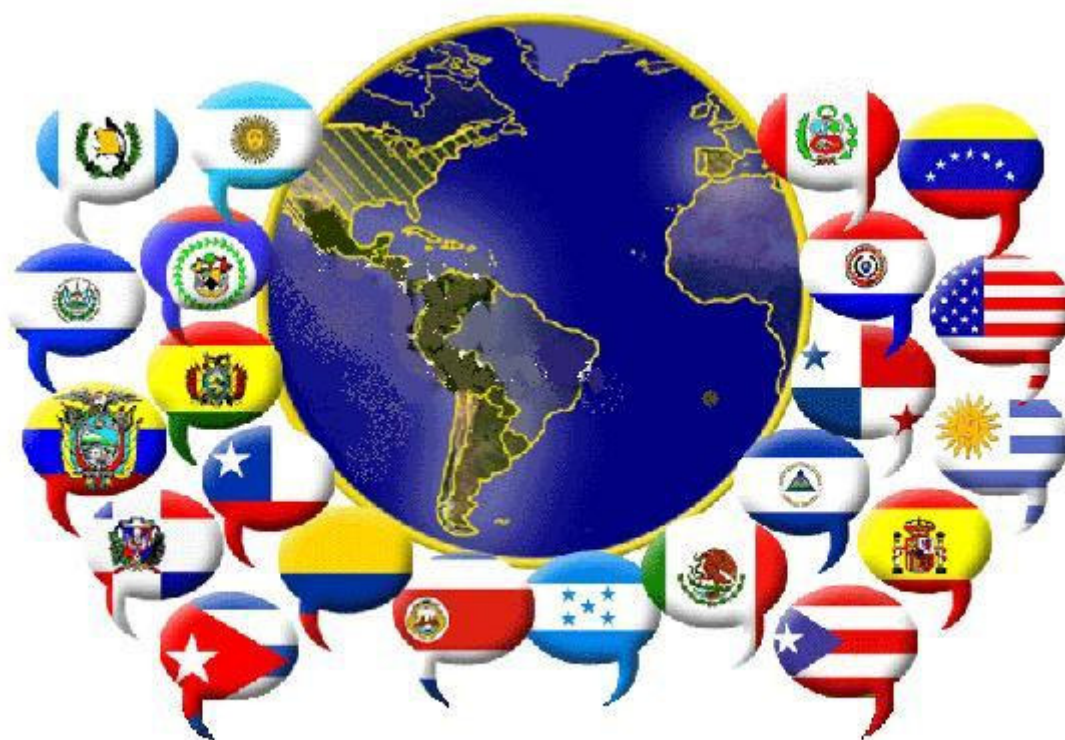
Imagem 6: Metáfora da diversidade geográfica experimentada pela língua espanhola e sua difusão no Brasil, de autoria nossa, adaptada a partir do logotipo do Proyecto Jergas de Habla Hispana . http://www.jergasdehablahispana.org/ Acesso: 02/jan/09.