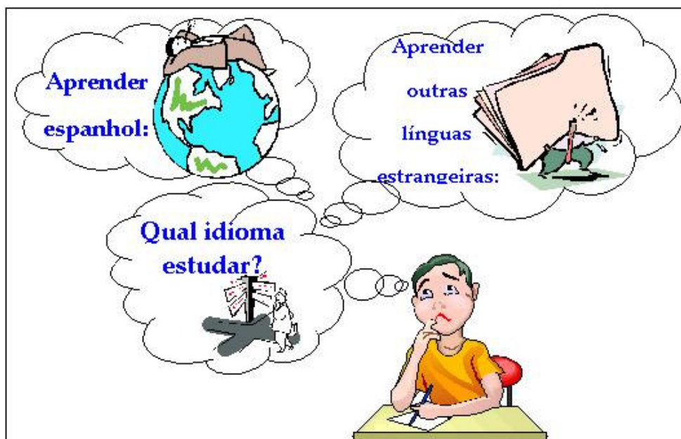
Imagem 8: A diferença entre aprender espanhol e outras línguas estrangeiras. (SOUZA et al , 2006, p.393)

Levando-se em conta um imaginário que impõe o estudo de línguas como uma necessidade essencial na contemporaneidade, o grupo pesquisado procura aprender espanhol, pois, segundo esse mesmo imaginário, na concepção da maioria desses alunos esta é uma língua que demanda pouco esforço do aprendiz.